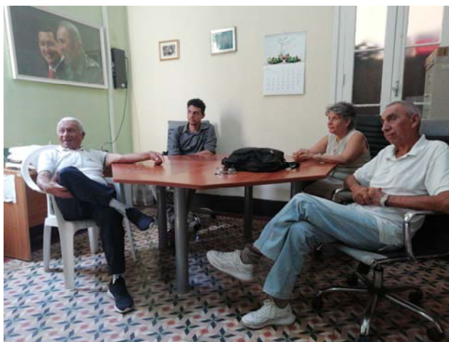
21 de mayo

Se coordinaron acciones para fortalecer la alianza entre ambas instituciones y solicitaron la participación de la ATAC en el Simposio Internacional de la Revolución Cubana a celebrarse del 29 al 31 de octubre 2024.