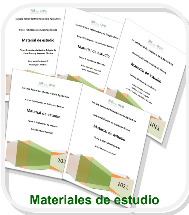
Materiales de estudio

El sistema de medios digital para el desarrollo del curso de Habilitación en Asistencia Técnica en la agricultura cubana son: materiales de estudio para cada tema, medios tecnológicos existente en las sedes. El modo de acción Audio conferencia, Rendición de cuenta, Despachos, Talleres de intercambios, Socialización, Divulgación de los resultados y Videoconferencia