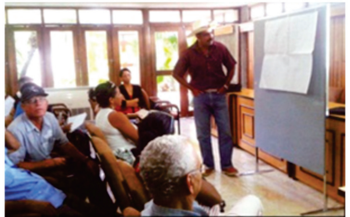
La divulgación de conocimientos es un elemento básico en el aspecto social de la agroecología.

Empleo del conocimiento. Apoyarse en el conocimiento de los campesinos, pero combinado con la aplicación de los resultados científicos. En este caso juega un papel fundamental la capacitación, la difusión de conocimientos, las áreas demostrativas, el extensionismo, la divulgación de las experiencias de los productores más exitosos, etc.