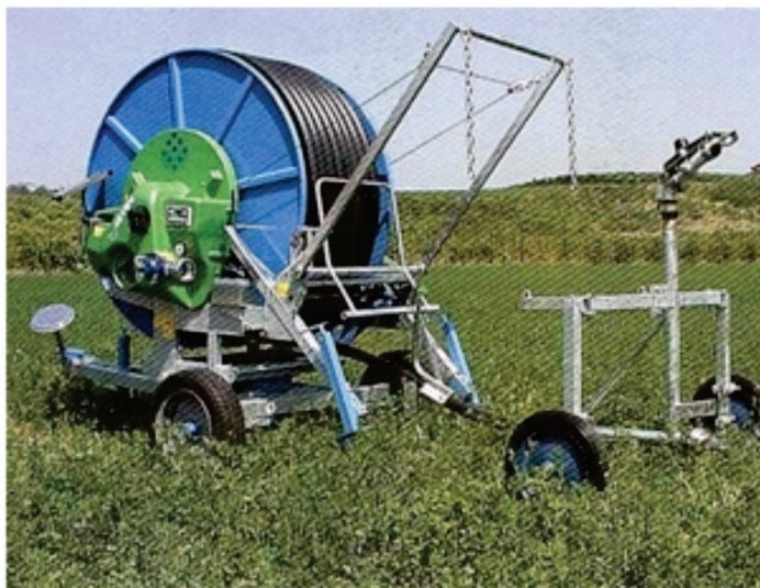
La escasez de agua para el riego seguirá siendo una limitante.

En la determinación de las necesidades hídricas de los cultivos y su posibilidad de satisfacción durante un periodo de tiempo determinado o para momentos futuros influyen múltiples factores muy variables: régimen de lluvias, temperatura, grado de desarrollo del cultivo, disponibilidad de agua para el riego, estado técnico de las maquinarias y las instalaciones, etc.