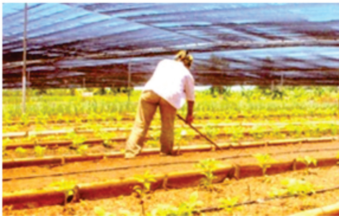
No puede haber una agricultura sostenible sin prácticas agroecológicas adecuadas.

La agroecología es un término mucho más amplio, pues es una disciplina científica, un conjunto de ideas basadas en los conocimientos ancestrales de los campesinos, que entienden la agricultura como parte integrante de un ecosistema, así como en los avances científicos.